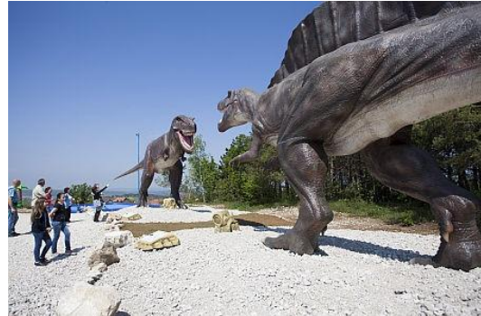
A Dínó park Reziben

sétálgatni, főleg, ha kieresztik hangjukat is. Kissé bizarr élmény, de élmény.