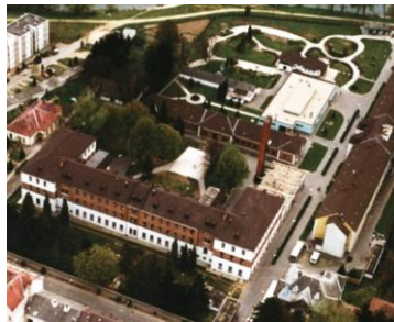
Szentgotthárdi Szakosított Otthon 9970 Szentgotthárd, Hunyadi út 29.