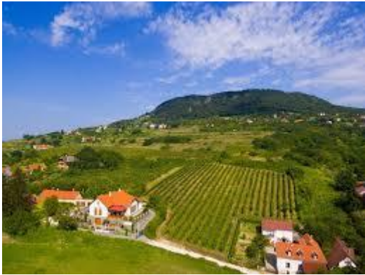
A csodás badacsonyi vár

Amikor szeptembert említjük az újságban, az egyet jelent a sok kirándulással és élménnyel. Minden osztályról több lakó vesz részt ezeken a programokon: Badacsony, Szigliget, Rezi, Kőszeg, Körmend voltak ebben az évben a helyszínek.