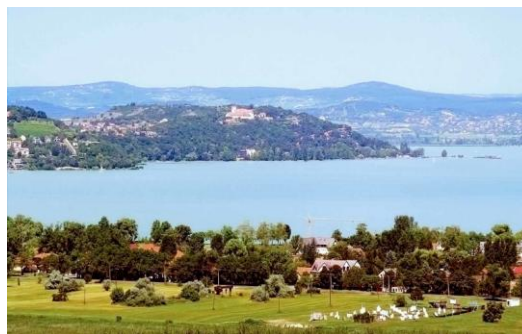
Csodálatos a táj

A tábor területén folyamatosan zajlottak a programok, lakóink bepillantást nyerhettek az alkotótábor némely programjába is. Ilyen például az egyre népszerűbb táncház és a könnyebben elsajátítható – újra reneszánszát élő batikolás. A nap végén volt amikor táncház vagy diszkó zárta az eseményeket.