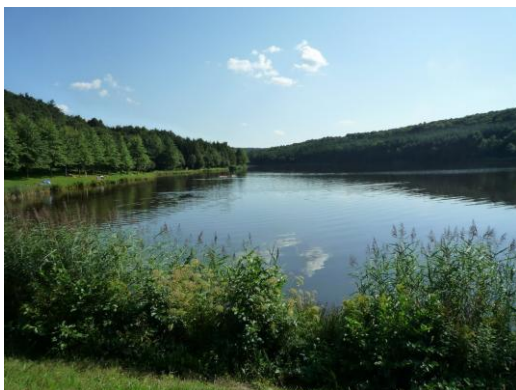
A gyönyörű tó

Ebben az évben a máraiújfalusi Hársas – tó partján tartotta csapatépítő napját az intézmény lakóönkormányzata. Az eseményre július hatodikán került sor.