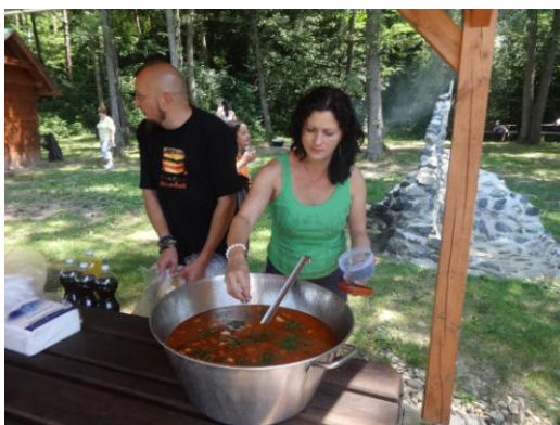
Elkészült az étel

A huszonnégy tag és kísérőik már a délelőtti órákban elfoglalták a tó partján lévő tűzrakó helyet és környékét, majd kezdetét vette a munka. A ragyogó nyári napsütésben mindenki kivehette részét az előkészületekből: ki a pakolásban, ki a tűzgyújtásban, ki a zöldségek pucolásában segédkezett, mások pedig üdítőt osztottak.