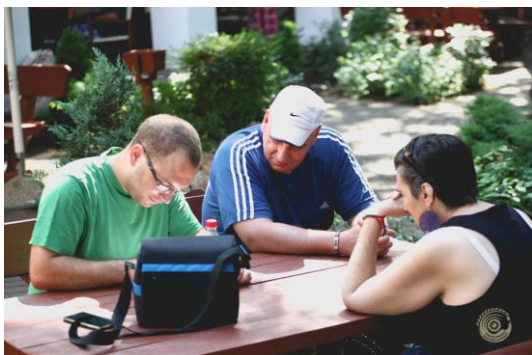
Alkot a csapat

A táborban 6 intézmény 30 lakója vett részt. Érkeztek filmes csapatok Bánhalmáról, Szolnokról, Budapestről, Szombathelyről és Szentgotthárdról. A tatai Öreg-tó Hotelbe történt megérkezésünket követően egy rövid megnyitó után el is kezdődött az alkotómunka.