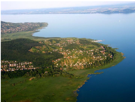
Gyönyörű a kilátás a szigligeti várból

A balatoni látogatások hosszú évek óta jól ismert úti célok, egyrészt a környék varázsa, másrészt a viszonylagos közelsége miatt. A badacsonyi móló, a borozó sor, az Egry József múzeum, a szigligeti vár gyönyörű panorámája már régi kedvencek, és több éve ugyanazon a helyen ebédel a csapat.