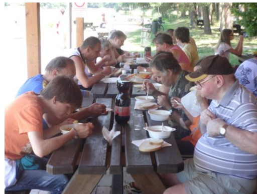
Mindenkinek ízlett a gulyás

édesség, gyümölcs sem maradt ki a menüből. Teli hassal természetesen nehéz a mozgás, így nem sok lakónk akadt, aki belement a vízbe. Pedig nagyon kellemes hőmérsékletű volt a tó, nem hiába gyűltek a fürödni vágyók a délutáni órákban.