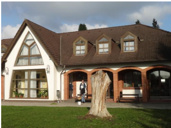
Az intézet foglalkoztató épülete