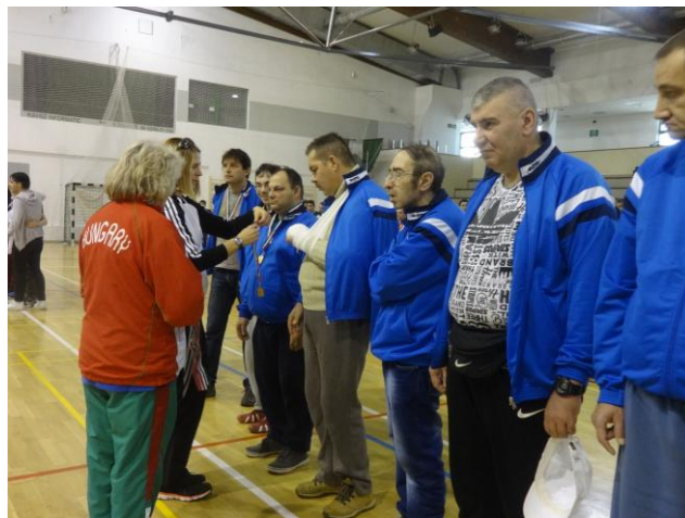
Csapatunk átveszi az érmeket