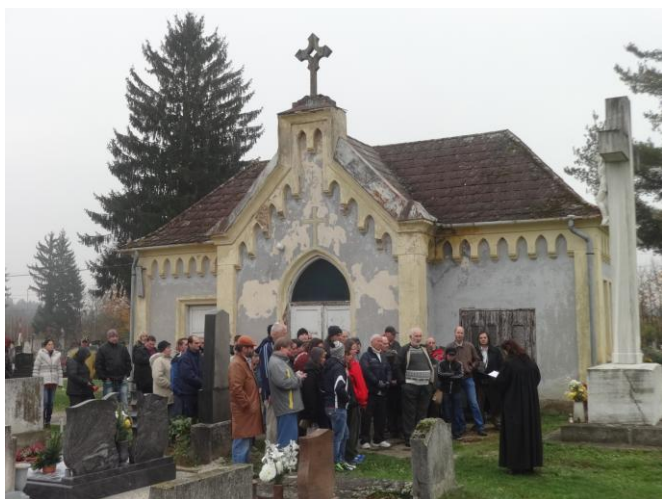
A lelkesző istentiszteletet tartott

Minden évben együtt látogatnak el a temetőbe lakóink, hogy egy rövid istentiszteletet követően megemlékezzenek egykori lakótársaikról és a távolban eltemetett szeretteikről. Október 29-én közel félszázan képviselték az intézményt.