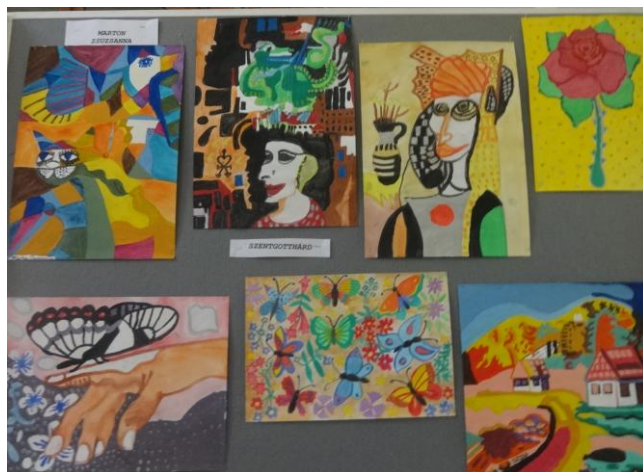
Az alkotások egy része