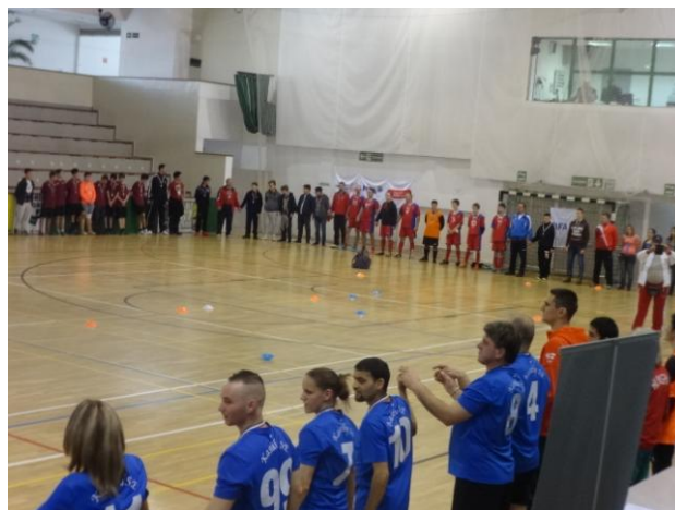
A résztvevő csapatok által formázott kör

Vasárnap délelőtt a bronzéremért küzdöttünk a budapestről érkezett Csalogány SE csapatával. A mérkőzésen mindenki beleadott anyait- apait, így csoportunkban megszereztük a bronzérmet.