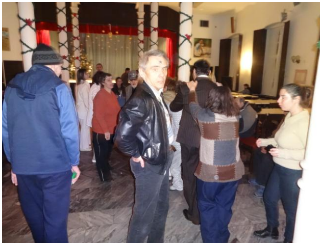
Sokan voltak idén is a bálban