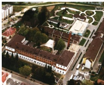
Szentgotthárdi Szakosított Otthon 9970 Szentgotthárd, Hunyadi út 29.