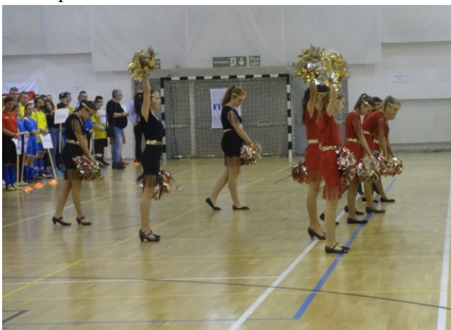
A programot nyitó mazsorett tánc

Péntek késő délelőtt elfoglaltuk szállásunkat a Batsányi János Gimnázium kollégiumában. Az ide érkezőket különös látvány fogadja, hiszen a földszint és az első emelet közt Árpád- házi és Anjou- királyok, az első és a második emelet közt pedig az aradi vértanúk és Batthyány Lajos portréi díszítik a falakat.