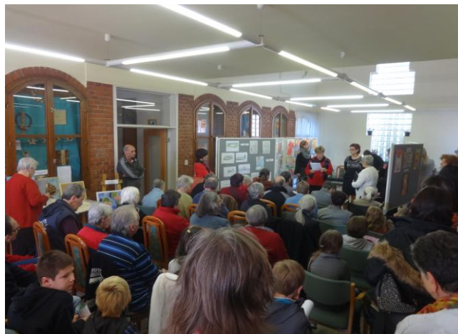
Az értékelés percei